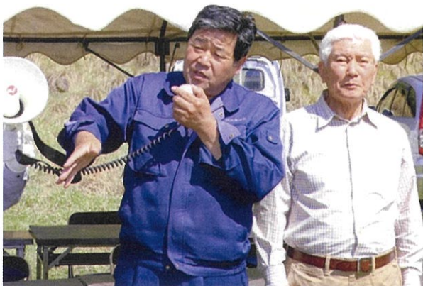
▲作業手順を説明する狐塚委員長(左)と高梨会長