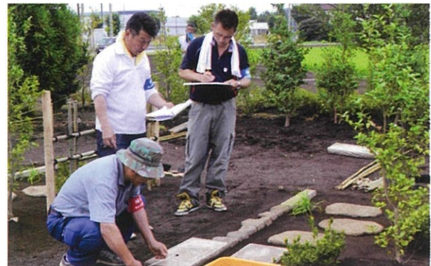
▲2級検定で検定委員と補佐員が各項目を審査して検定完了となる。