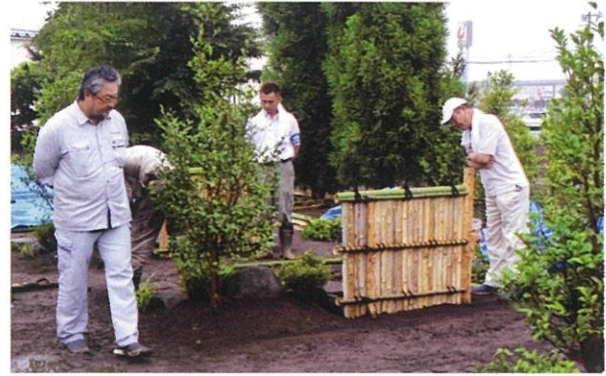
▲大雨でぬかるんだ足場での作業。水平を出す難しさに直面する。