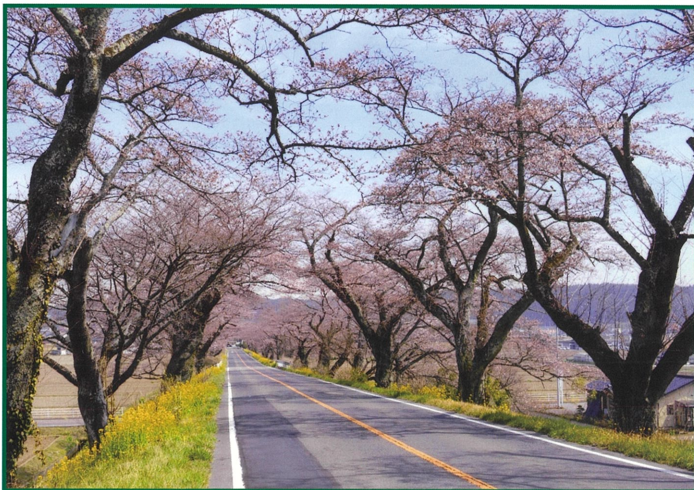
【植え替え事業が本格化するさくら市の名所「早乙女の桜並木」(県道佐久山喜連川線)=4月5日】

足尾の植樹活動18年目《松木地区に蘇る緑の森》 令和元年度造園技能検定／大雨により一時中断!!