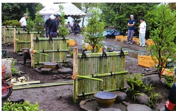
▲大雨で一時中断する中、5名の受験者は全員作業完了。制限時間もピッタリ。