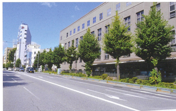
▲宇都宮市南大通り（いちょう通り）

【イチョウ】一科一種。雌雄異種。葉は扇形で中央に裂け目があり、秋に黄葉する。種子は銀杏（ぎんなん）と呼ばれ、食用。中国原産で、盆栽はじめ公園樹、街路樹に多用される。落葉高木で、高さ50メートル近くにもなる。