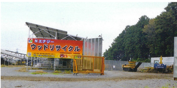
▲広大な敷地を有する樹木リサイクル施設