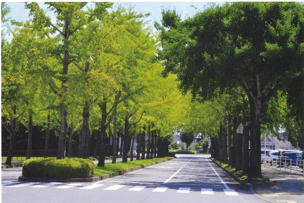
▲壬生町獨協医科大学病院前