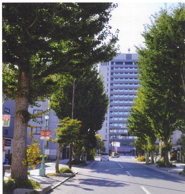
▲宇都宮市役所正面入り口前

【イチョウ】一科一種。雌雄異種。葉は扇形で中央に裂け目があり、秋に黄葉する。種子は銀杏（ぎんなん）と呼ばれ、食用。中国原産で、盆栽はじめ公園樹、街路樹に多用される。落葉高木で、高さ50メートル近くにもなる。