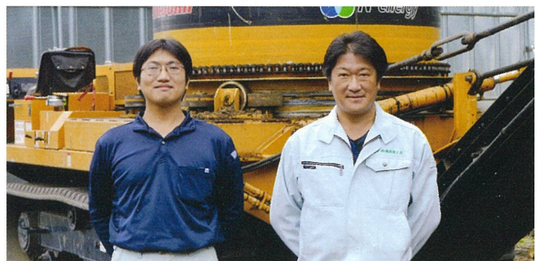
▲工場長の礧隆志さん(左)と礧一弘社長(右)