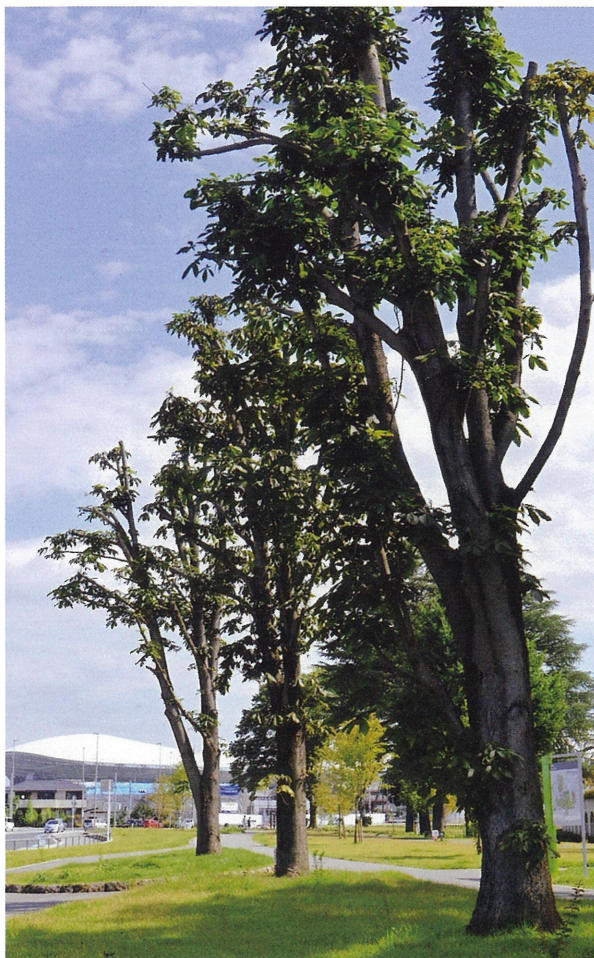
▲栃木県庁前シンボルロードから移植されたトチノキ