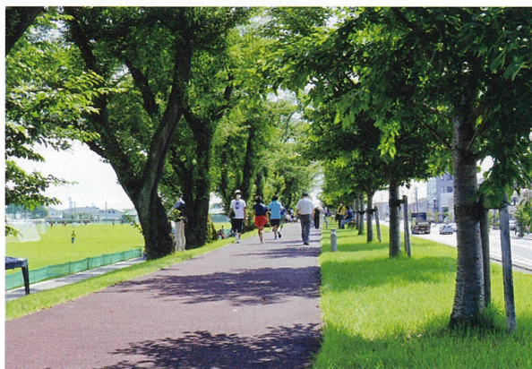
▲ランニングロードを挟んで左側がラグビー場とサクラの古木。右側は平成29年に福田知事らによって植えられたサクラの新木。