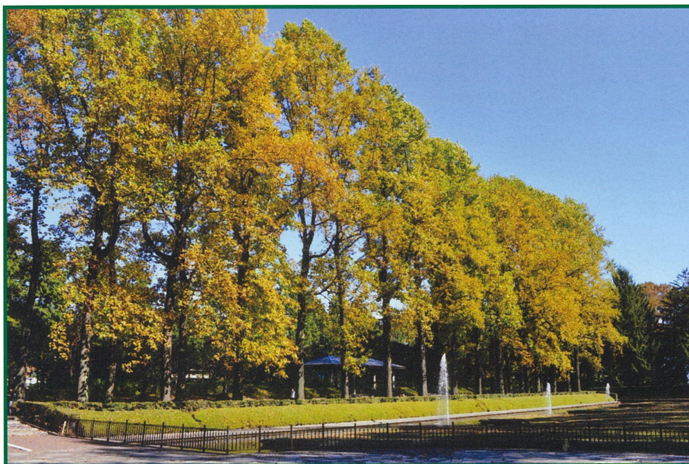
【黄葉のユリノキ並木（県中央公園）】