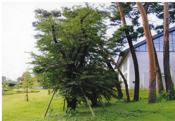
▲ラグビー競技場脇から移植されたソメイヨシノ