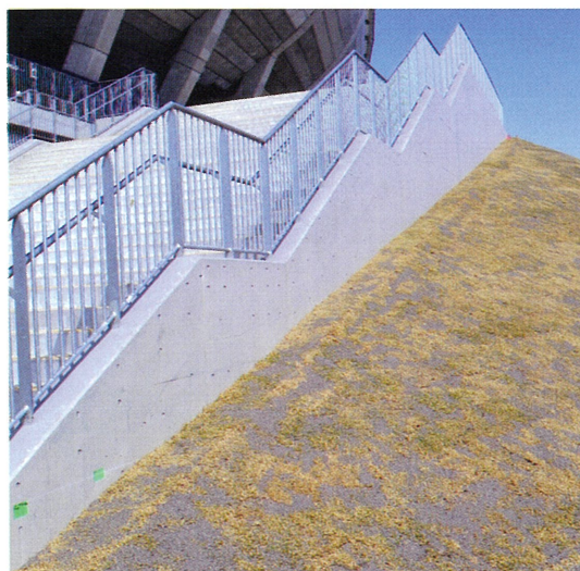
▲斜面の土盛りが課題となった（2019年12月1日）