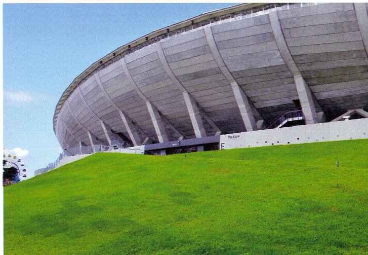
▲カンセキスタジアムとちぎE門（2020年8月1日）