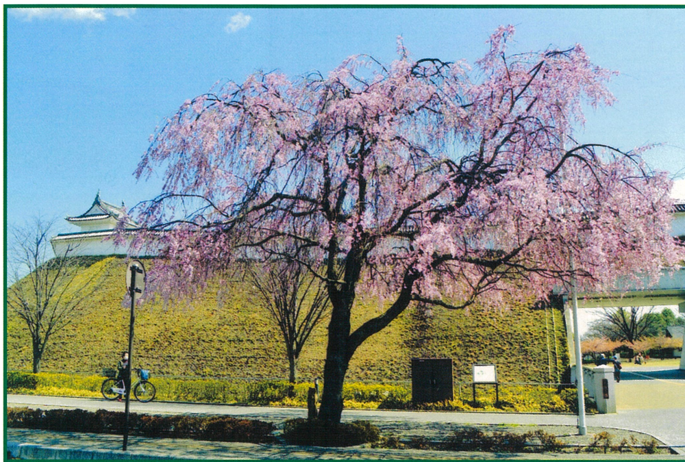
【宇都宮城址公園入り口の仙台シダレザクラ】