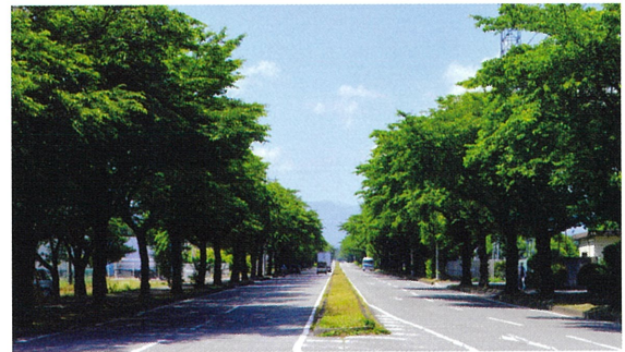
◀大田原市野崎第二工業団地(2021・3・29)と葉桜の様子(2020・6・7)▲

【サクラ】バラ科サクラ属の落葉高木の総称。日本の代表的な花として世界に知られる。ヤマザクラ、オオシマザクラ、ヒガンザクラ等が有名で、日本の街路樹には、ソメイヨシノが最も多い。そのソメイヨシノの寿命は80年前後と言われ、街路樹としての「サクラ」にも一考が必要だ。