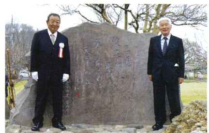
▲除幕を祝う高梨会長(右)と大橋氏