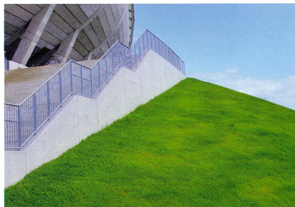
▲斜面が見事に安定した（2020年8月1日）