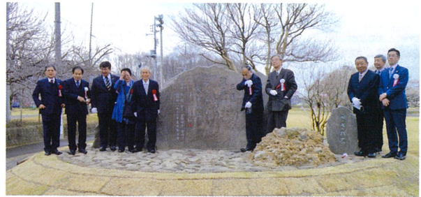
▲歌碑建立を祝う広瀬市長（左から3人目）と実行委員会のメンバー