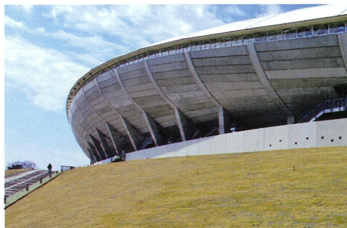
▲芝張り間もないE門（2020年2月28日）