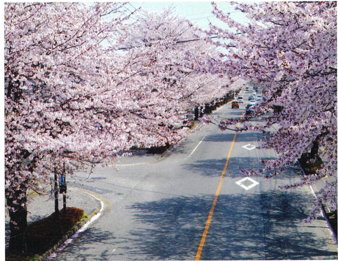
▲鹿沼市さつき大通り/ふれあい歩道橋より(2021・3・30)

【街路樹】道路の両側に列植された中高木の樹木をいう。大気の浄化、炭酸ガスの吸収と酸素の供給といった環境衛生面での効用のほか、緑蔭や木洩れ日を生む。近代的な街路樹は、1867(慶応3)年に横浜の馬車通りにヤナギとマツが植えられ、1874(明治7)年には、東京の銀座通りにサクラ、マツが植えられた。1884年になってシダレヤナギに植え替えられたそうだ。後に、イチョウ、スズカケノキ、ユリノキ、トチノキ、トウカエデ、エンジュ、ミズキ等10種が選定され、今日の大勢の基ができた。