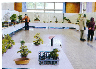
▲ファン待望の盆栽展

ファン待望の盆栽展が2月26日から3日間、那須野が原公園緑の相談所で開かれた。日本盆栽協会那須支部などが主催で、盆栽展の最高峰といわれる「国風盆栽展」で入選したゴヨウマツ、カエデなど名品20点が並んだ。