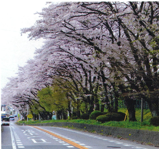
▲宇都宮市白沢街道/高崎製紙前(2021・3・29)