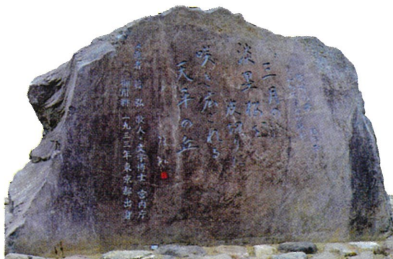
▲篠弘氏揮ごうの歌碑