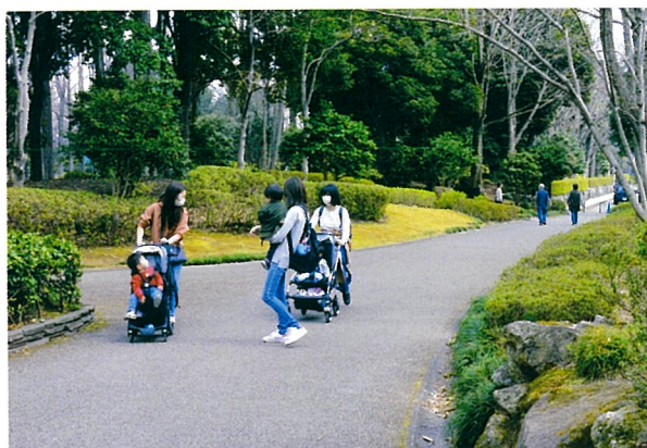
▲県中央公園 (2020年3月27日午前)

県は、2020年度の県営都市公園9公園の利用者数を前年度比75万1297人(17%)減の367万8357人と発表した。利用者数400万人を割り込んだのは12年ぶりということになる。