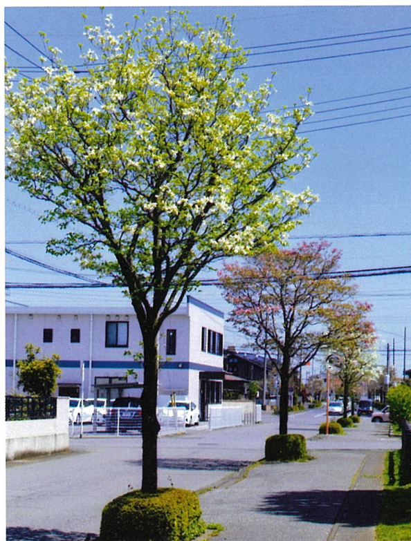
宇都宮市平松本町・石沢西公園付近（4月）▶

【街路樹】道路の両側に列植された中高木の樹木をいう。大気の浄化、炭酸ガスの吸収と酸素の供給といった環境衛生面での効用のほか、緑蔭や木洩れ日を生む。近代的な街路樹は、1867(慶応3)年に横浜の馬車通りにヤナギとマツが植えられ、1874(明治7)年には、東京の銀座通りにサクラ、マツが植えられた。1884年になってシダレヤナギに植え替えられたそう。後に、イチョウ、スズカケノキ、ユリノキ、トチノキ、トウカエデ、エンジュ、ミズキ等10種が選定され、今日の大勢の基ができた。