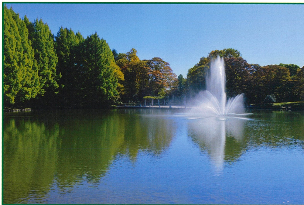
【栃木県中央公園昭和大池の晩秋】