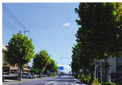
▲宇都宮市平成通り（10月）

【プラタナス】スズカケノキ科スズカケノキ属（プラタナス）の総称。北半球に6種あり、日本ではスズカケノキ、アメリカスズカケノキ、モミジバスズカケノキなどを街路樹にする。