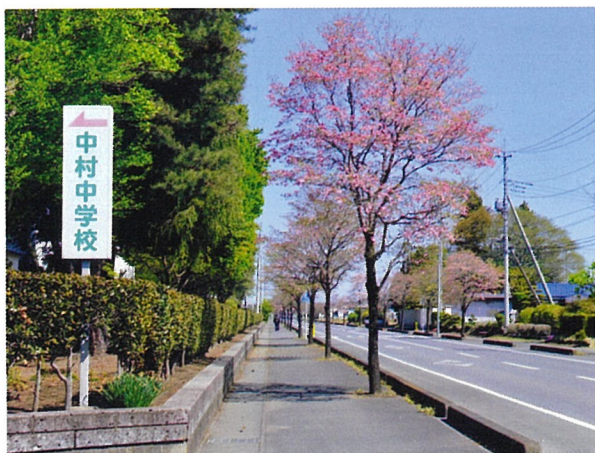
▲真岡市中村中学校入り口（4月）

【ハナミズキ】ミズキ科の落葉高木。北アメリカ原産で園芸品種もあり、白色または淡紅色の花に人気が高い。大正初期に日本へ導入された。アメリカヤマボウシ。