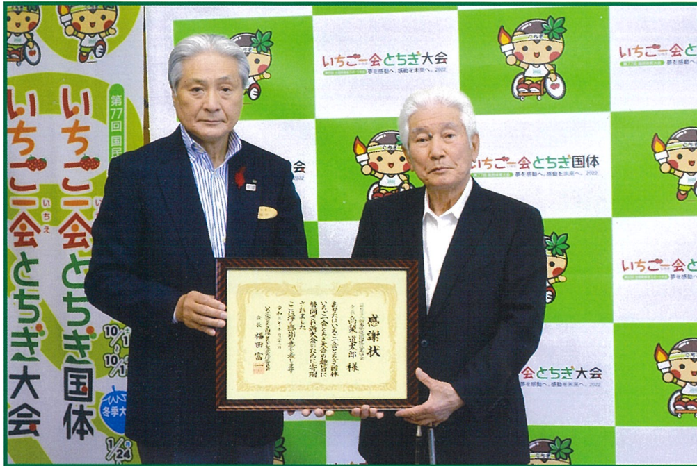
【いちご一会とちぎ国体・とちぎ大会に係る高額寄附感謝状贈呈式=2021年10月22日午後、県庁】