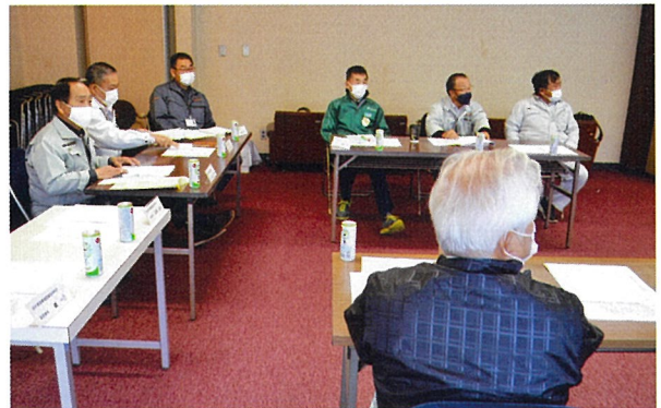
▲11月8日(月) 例会／北山霊園視察を兼ねて