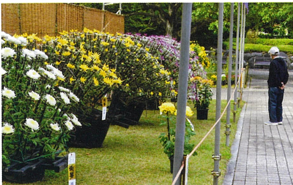
▲11月1日(月) 中央公園「菊花展」初日