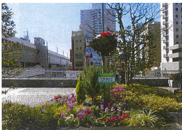
▲JR宇都宮駅西口の「餃子の像」隣に設置された「ウェルカム花壇」

宇都宮市造園協同組合は、平成18年8月1日に設立。現在は市内25の造園業者で構成されている。設立当初の「趣意書」には、平成12年開催「第17回全国都市緑化とちぎフェア（マロニエとちぎ緑花祭2000）」以後、中小造園工事業者を取り巻く経営環境は厳しい局面を迎え、新規の公園緑地工事の増加は見込めない状況下、指定管理者制度の導入などで、経営の合理化や個々の営業努力でこの困難な状況を打開できなくなった。そこで今般、地域の中小