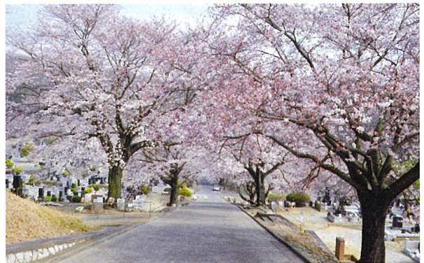
▲クビアカツヤカミキリ被害が心配される北山霊園の桜