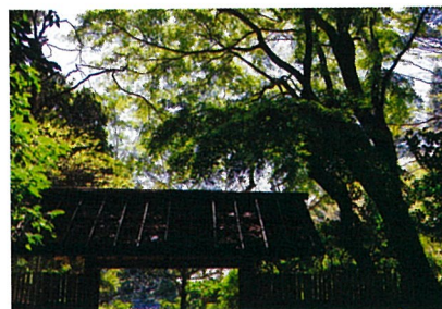
▲モミジの庭門 （日本庭園庭門）

開園40年となると当初植えられた樹木も立派に成長した。特に、メタセコイヤ・ユリノキ・モミジは最たるもので、大木化・巨木化が懸念される。公園を散歩する人の「視線」と「光」の確保が重要な課題になってくる。