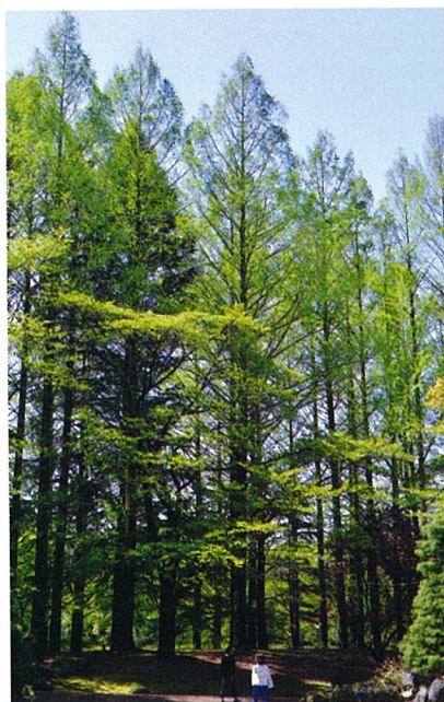
▲メタセコイヤの湖畔 （昭和大池畔）