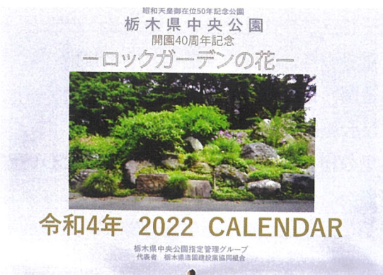
▲2022カレンダー「ロックガーデンの花」