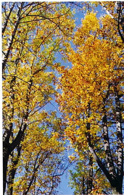
▲ユリノキ並木 （沈床園周囲）

開園40年となると当初植えられた樹木も立派に成長した。特に、メタセコイヤ・ユリノキ・モミジは最たるもので、大木化・巨木化が懸念される。公園を散歩する人の「視線」と「光」の確保が重要な課題になってくる。