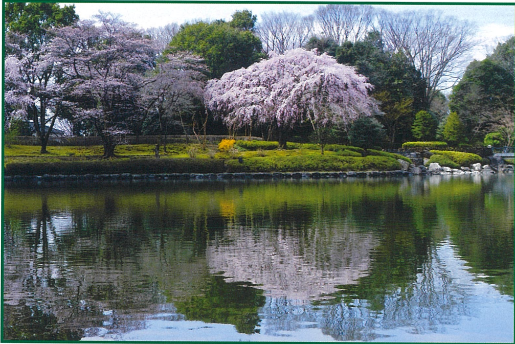
【10月に開園40周年を迎える栃木県中央公園（宇都宮市）】